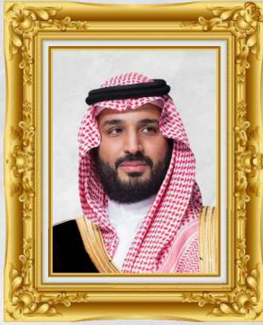
صاحب السمو الملكي ولي العهد

الأمير محمد بن سلمان بن عبدالعزيز آل سعود