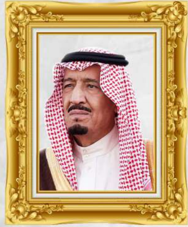
خادم الحرمين الشريفين

الأمير محمد بن سلمان بن عبدالعزيز آل سعود