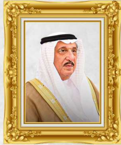
صاحب السمو الملكي أمير منطقة جازان

الأهـيـبـ / محـمـد بن عبد العـزـيـز بن محـمـد بن عبد العـزـيـز آل سـعـود