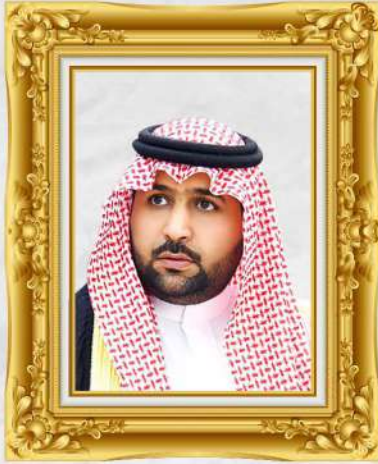
صاحب السمو نائب أمير منطقة جازان

الأهـيـبـ / محـمـد بن عبد العـزـيـز بن محـمـد بن عبد العـزـيـز آل سـعـود